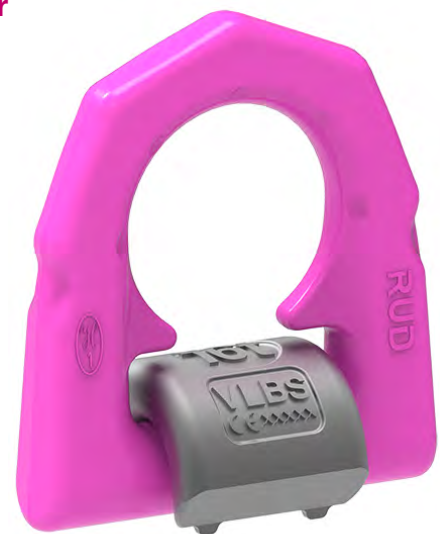
VLBS-U 16 t (mit Feder) / VLBS 16 t (ohne Feder)