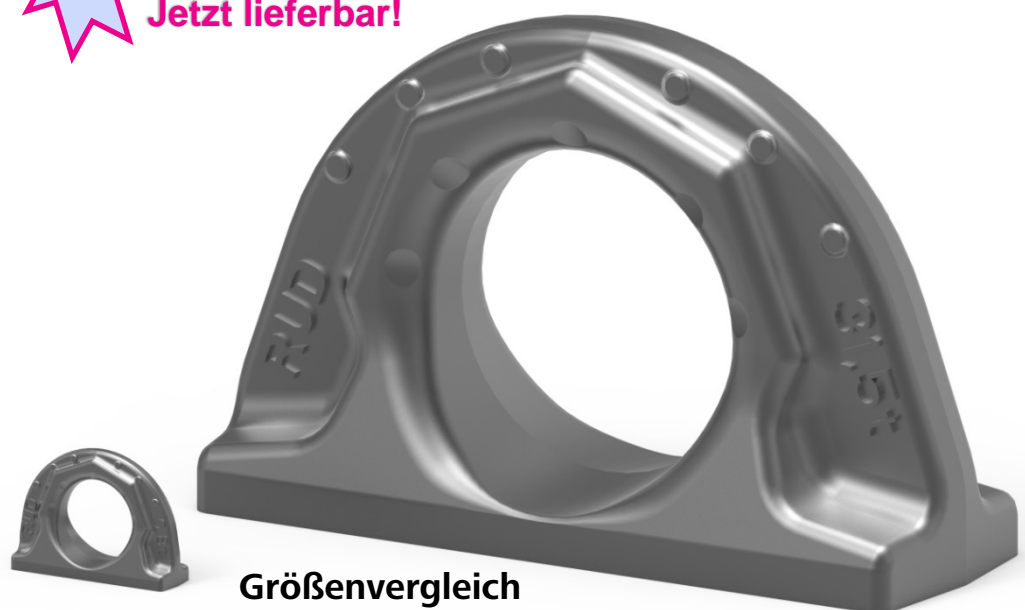
Größenvergleich ABA 0,8 t und ABA 31,5 t