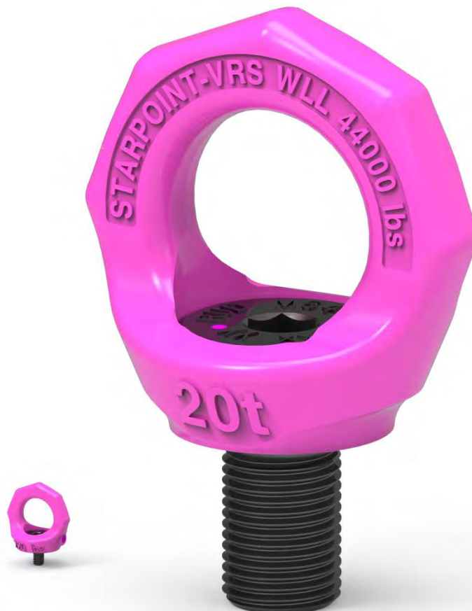
Größenvergleich VRS M6 und VRS M64